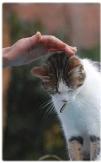
caresser un chat= to pet a cat